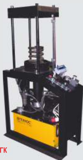
ПГТ 5 - 200 СГК