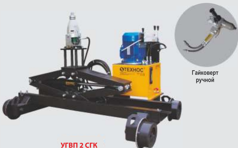
УГВП 2 СГК